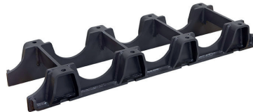
DEFENSA EXCAVADORA EC210B-EC210C EC235C-EC240B