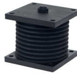
SILENT BLOCK A35D / A35E A40D / A40E